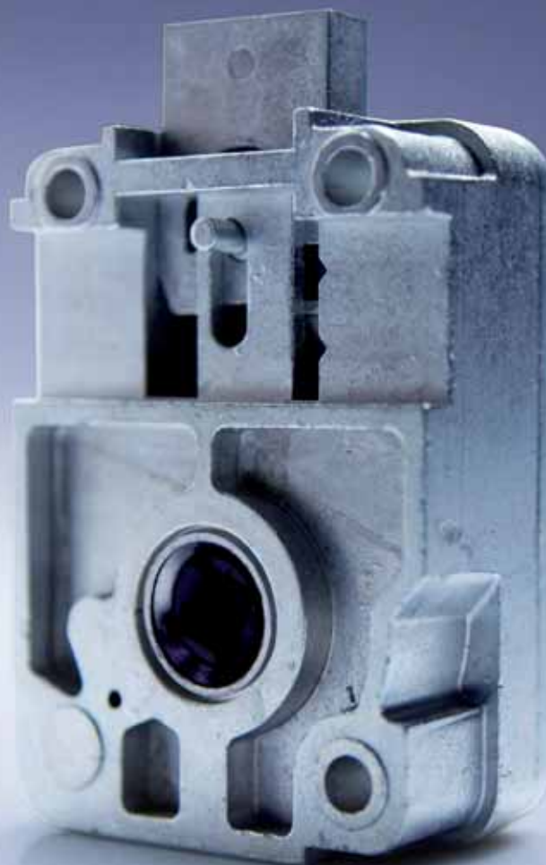
De llave cambiabile